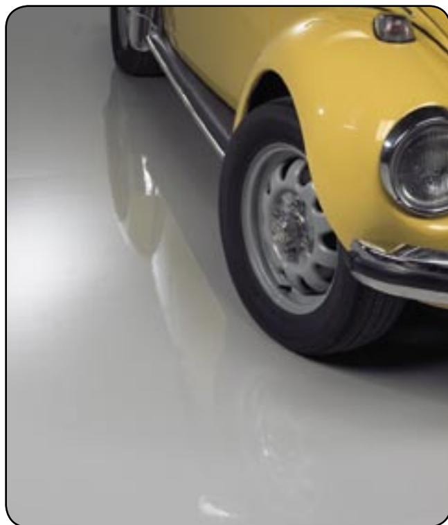
Gulvmaling EP-V Blank (003)

Gulvmaling EP-V Tykfilm vandbaseret 2-komponent epoxy maling. Til maling af beton, træfiberplader m.m. Glansgrad ca. 65, ved tykke lag reduceres glansgraden. Produktet kan med fordel anvendes som tykfilmsmaling, da man kan påføre en tykkelse på op til 150µm i et lag.